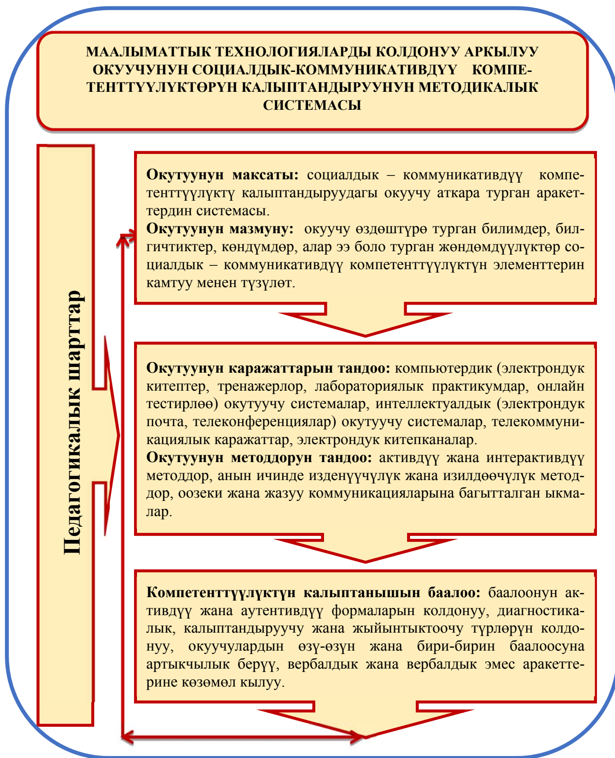
2 - сүрөт. Маалыматтык технологияларды колдонууда окуучулардын социалдык-коммуникативдүү компетенттүүлүктөрүн калыптандыруунун методикалык системасы.

Биринчи этапта окуу процессинде окутуунун максатын жана мазмунун аныктоого карата даярдык жүрдү. Алдыңкы мугалимдердин иш-тажрыйбаларын талдоонун натыйжасында окуучулардын социалдык-